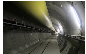
Erkundungsstollen Aicha BBT