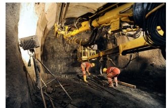
Bauarbeiten im Erkundungsstollen Innsbruck Ahrental BBT

Zu diesem Anlass findet vom 25. bis 27. Oktober eine gemeinsame Exkursion von Kammer, VSVI Oberbayern und VBI in das herbstliche Südtirol statt. Es ist eine Busreise von München aus geplant, die über den Brenner in die schöne Bischofsstadt Brixen führt. Am 26. Oktober besteht die Möglichkeit, den Kongress zu besuchen und am 27. Oktober steht eine Baustellenbesichtigung des Brenner-Basistunnels auf dem Programm.