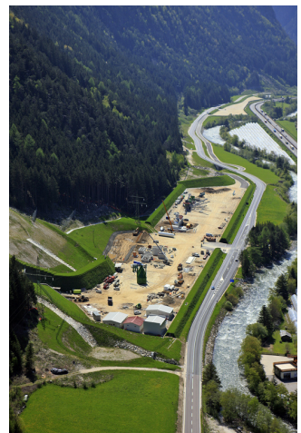
Baustelle Mauls BBT

Fotos/Grafik: Eventus- IMS OK Team (2) Brenner Basistunnel BBT SE (3)