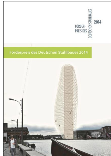
Dokumentation "Förderpreis des Deutschen Stahlbaues 2014"