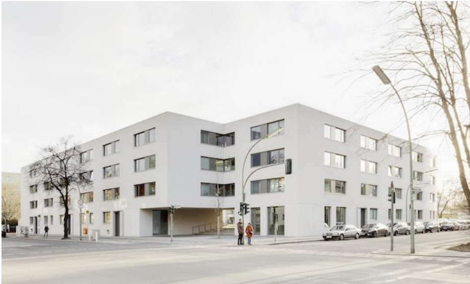
Wohnungsbau am Schillerpark in Berlin von Bruno Fioretti Marquez Architekten, Berlin.