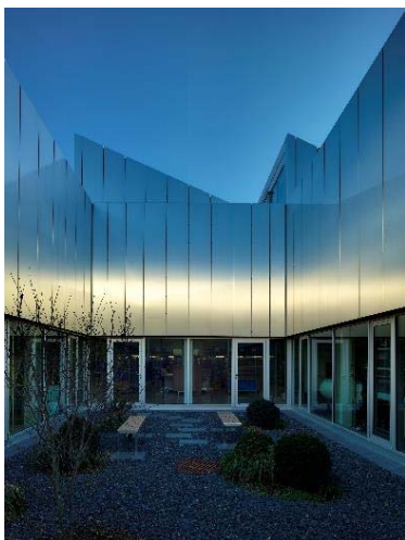
Gewinner Preis des Deutschen Stahlbaues 2016: Serviceteilecenter Rational Landsberg am Lech