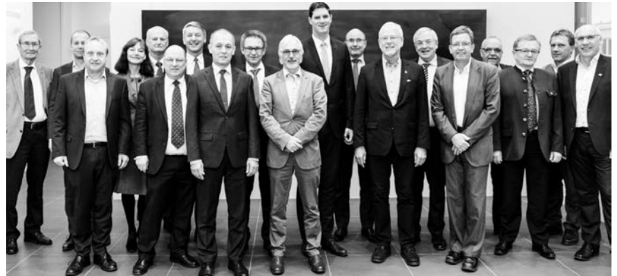
Vertreter der Baylka-Bau und des BBIV vor der Sitzung.

Der sehr offene und konstruktive Austausch bezog sich vorrangig auf das Partnerschaftliche und Verbindende aller am Bau Beteiligten. „Für die Sicherung und Weiterentwicklung unserer modernen Gesellschaft ist ein partner-