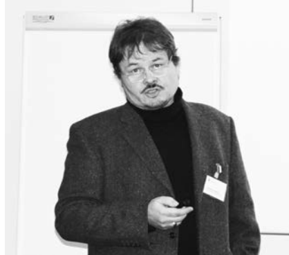
Dipl.-Ing. Univ. C. Dingethal

Um die Teilnehmer über das aktuelle Kammergeschehen zu informieren, sprach Herr Amler zu Beginn des Forums über laufende Projekte, wie die neuen Vorlagen für den Standard-