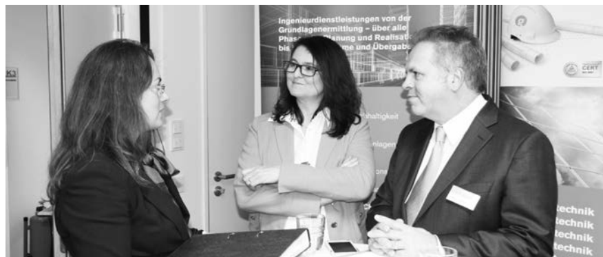
Eine gute Gelegenheit ins Gespräch zu kommen - der Netzwerkabend.

Studierende, Absolventen, Berufseinsteiger oder Erfahrene beziehungsweise auf der Suche nach Werkstudenten, Praktikanten, Bachelor- und Masterab-